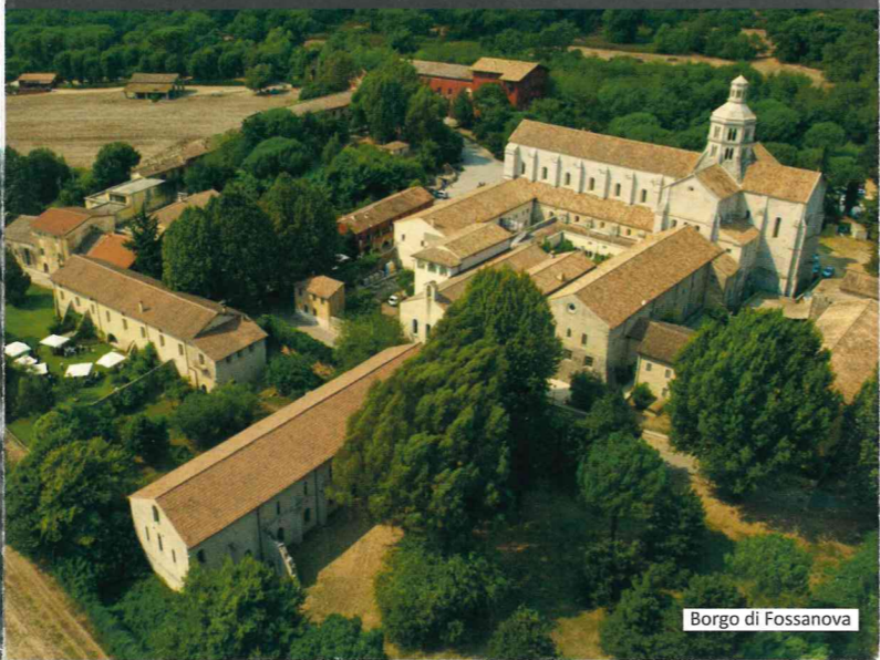
Borgo di Fossanova