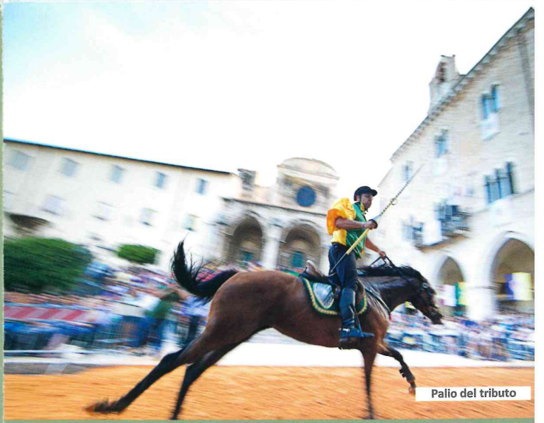
Palio del tributo

INFOPOINT PORTA DEI BORGHILEPINI Borgo di Fossanova Tel. +39 0773 902744 www.antichiborghilepini.it info@antichiborghilepini.it