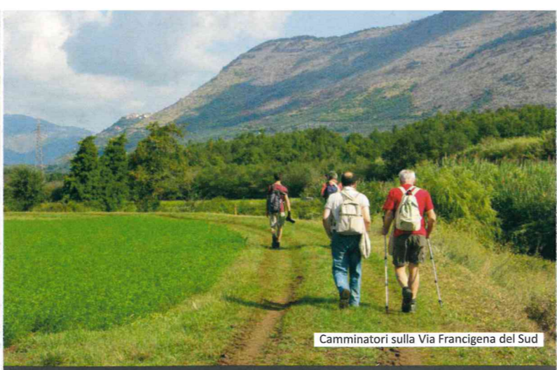
Camminatori sulla Via Francigena del Sud